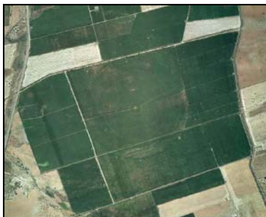
Cultivos herbáceos – TIPO_0124: “/otros cereales (distinto del arroz)” – FORZADO: “/no”– RIEGO_0123: “/regadío”