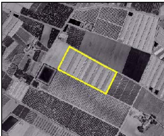
Cultivos herbáceos – TIPO_0124: “/otro” – FORZADO: “/sí”– RIEGO_0123: “/regadío”