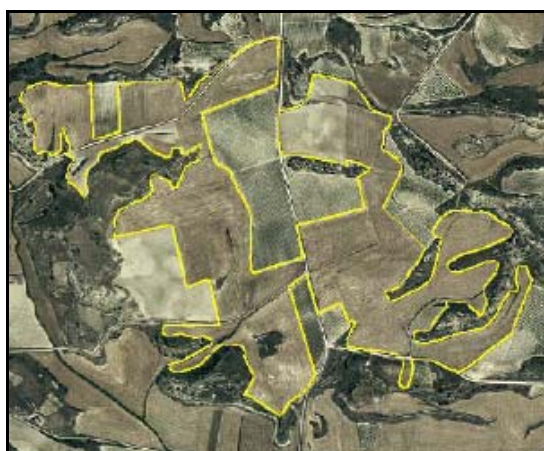
Cultivos herbáceos – TIPO_0124: “/otros cereales (distinto del arroz)” – FORZADO: “/no”– RIEGO_0123: “/secano”